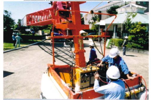
100m観音像リニューアル 100m作業 300Tクレーン