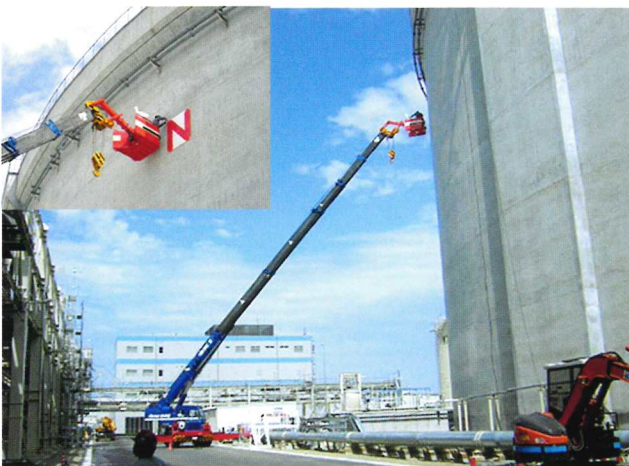
LNGタンク看板作業 半径25m 50Tラフター