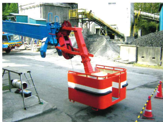
200T フルオートジブ取付

ボックスの外側は鋼板で囲い、高所における搭乗者の風よけと恐怖心を少なくしています