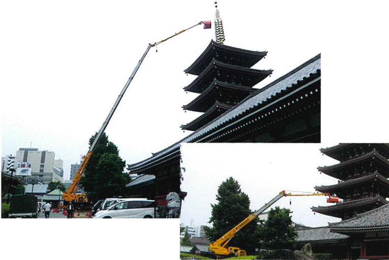
五重塔メンテナンス 50m作業 60Tラフター