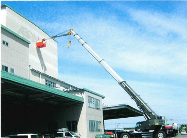
倉庫看板作業 半径30m 50Tラフター