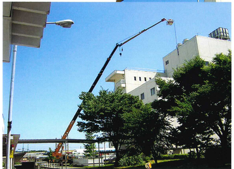
ビル避雷針交換 半径30m作業 50Tラフター