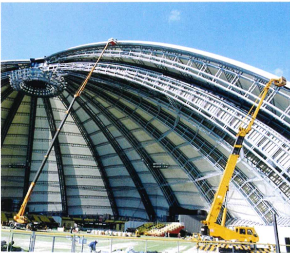
ドーム塗装 55m作業 50Tラフター