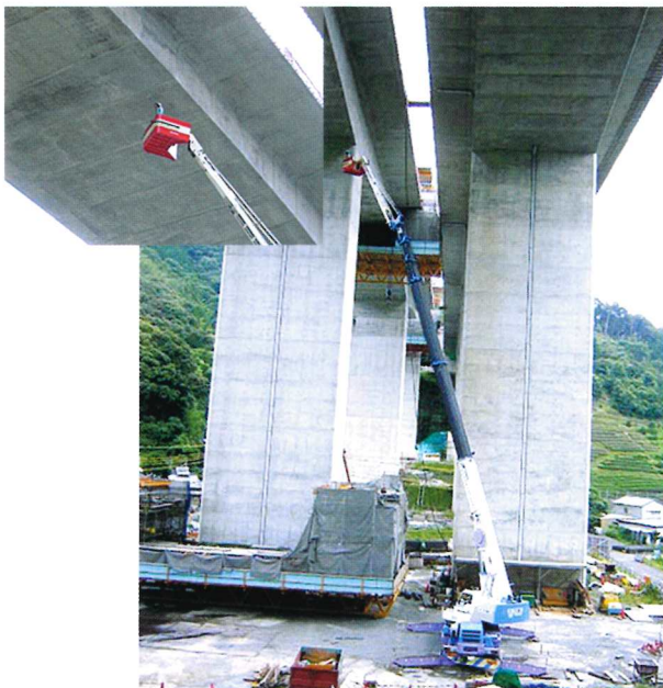
高速道 橋桁点検 40m作業 50Tラフター