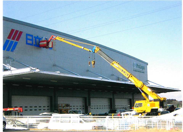
倉庫看板作業 半径20m 25Tラフター