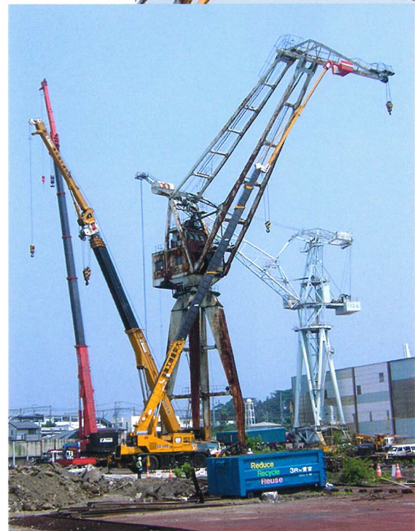
造船所クレーン解体 50m作業 50Tラフター