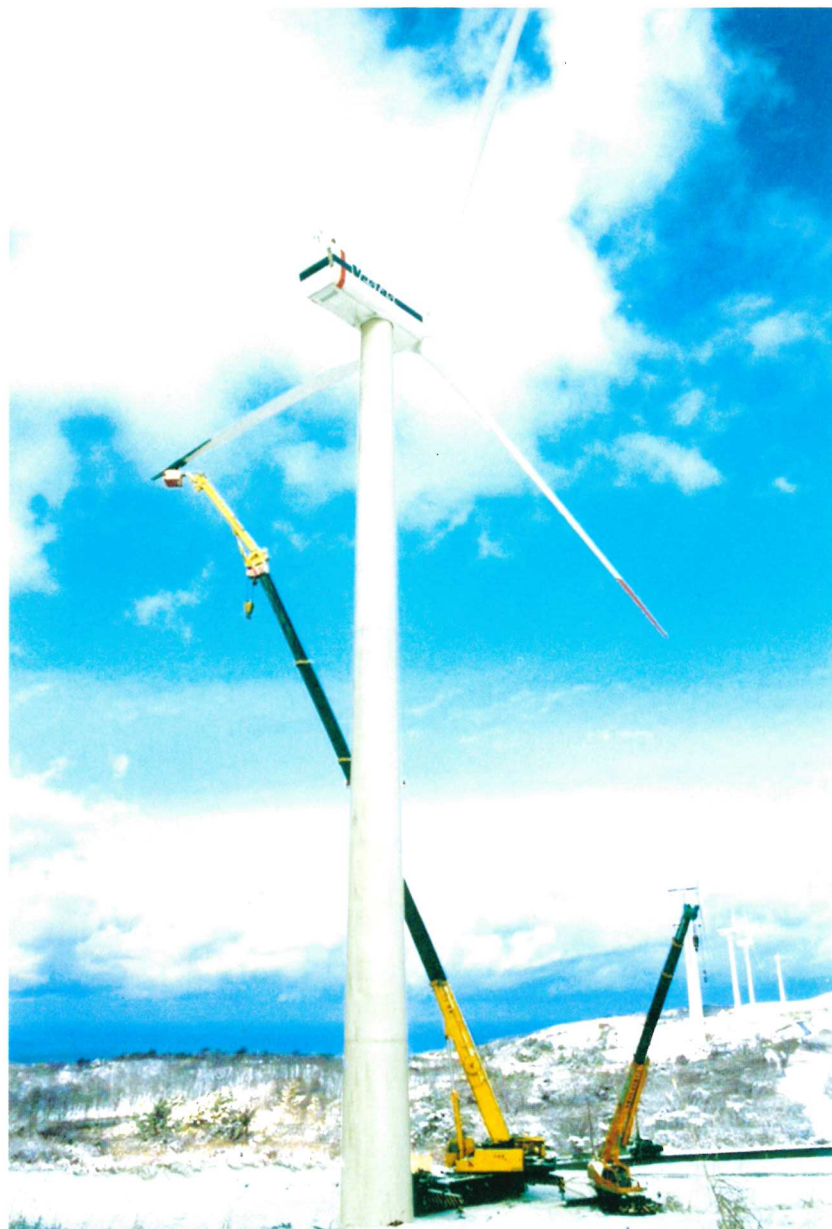
200Tフルオートジブ装着